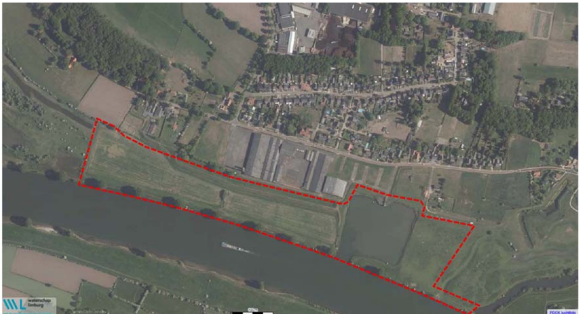
Figuur 1: Het plangebied voor de Kaderrichtlijn Water-maatregel Milsbeekse uiterwaard

Het resultaat is een heringericht plangebied van circa 13,8 hectare en de realisatie van circa 1,9 km geulen. Onderstaande figuren geven het plangebied, schetsontwerp en principe profiel weer voor de Kaderrichtlijn Water-maatregel Milsbeekse uiterwaard, zoals die november 2021 zijn overeengekomen bij de toevoeging aan het project Lob van Gennep. Dit vormt het uitgangspunt en startpunt voor de verdere planuitwerking en realisatie van deze KRW-maatregel.