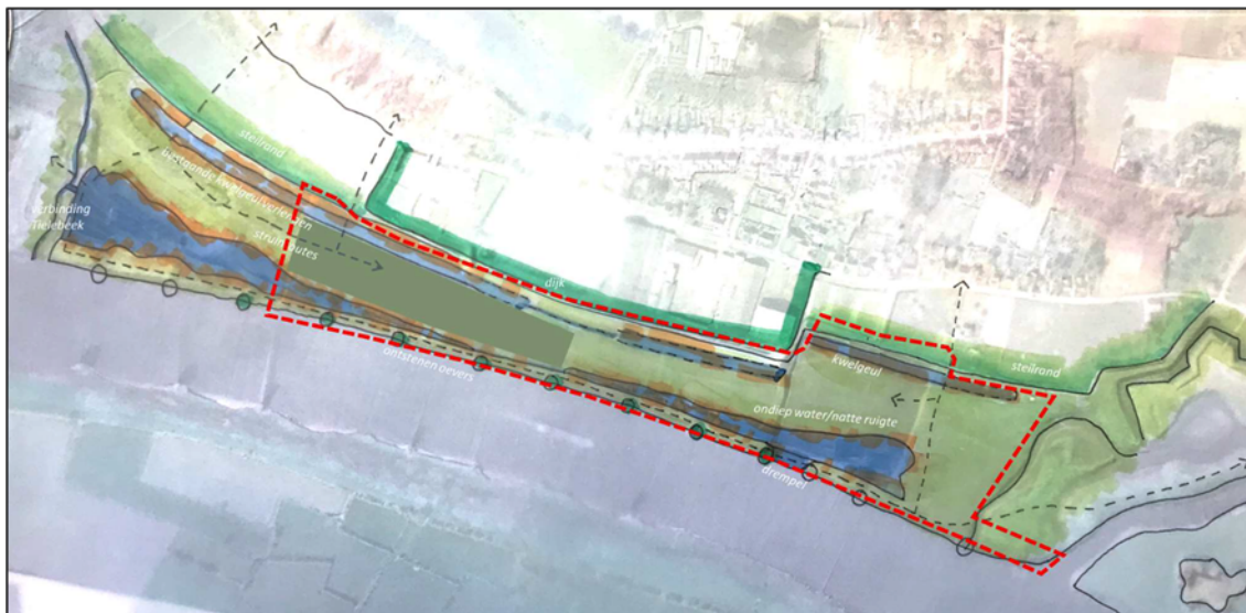
Figuur 2: Schetsontwerp Kaderrichtlijn Water-maatregel Milsbeekse Uiterwaard