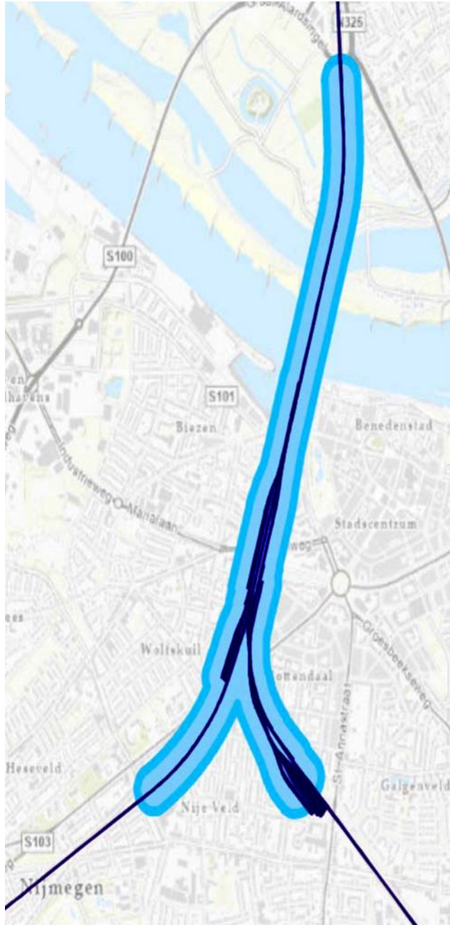
C1.1 Gebied met vrijstelling van verplichting tot naleving GPP's gedurende realisatie.