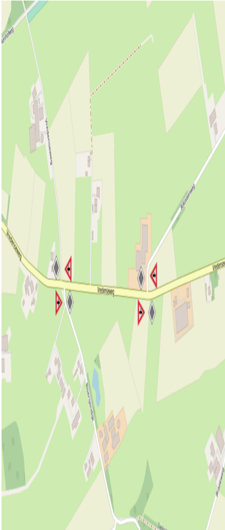
Lichtenvoorde, 11 december 2019