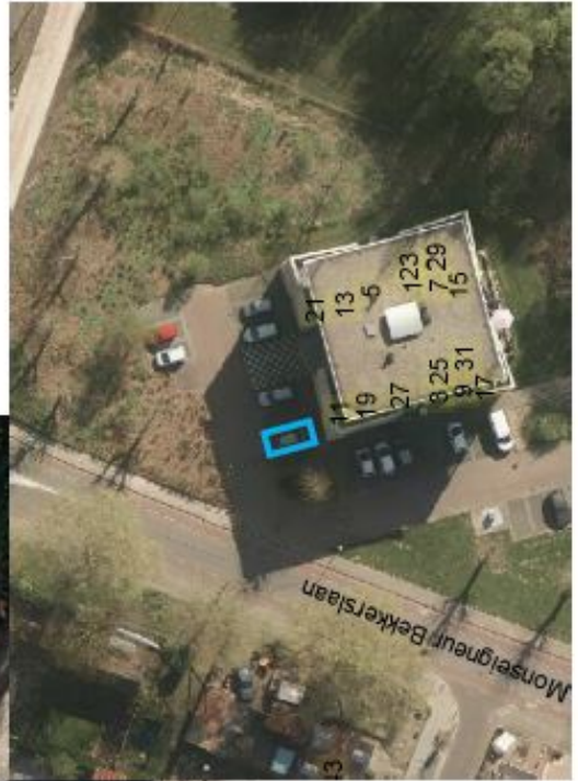
Gehandicaptenparkeerplaats op kenteken