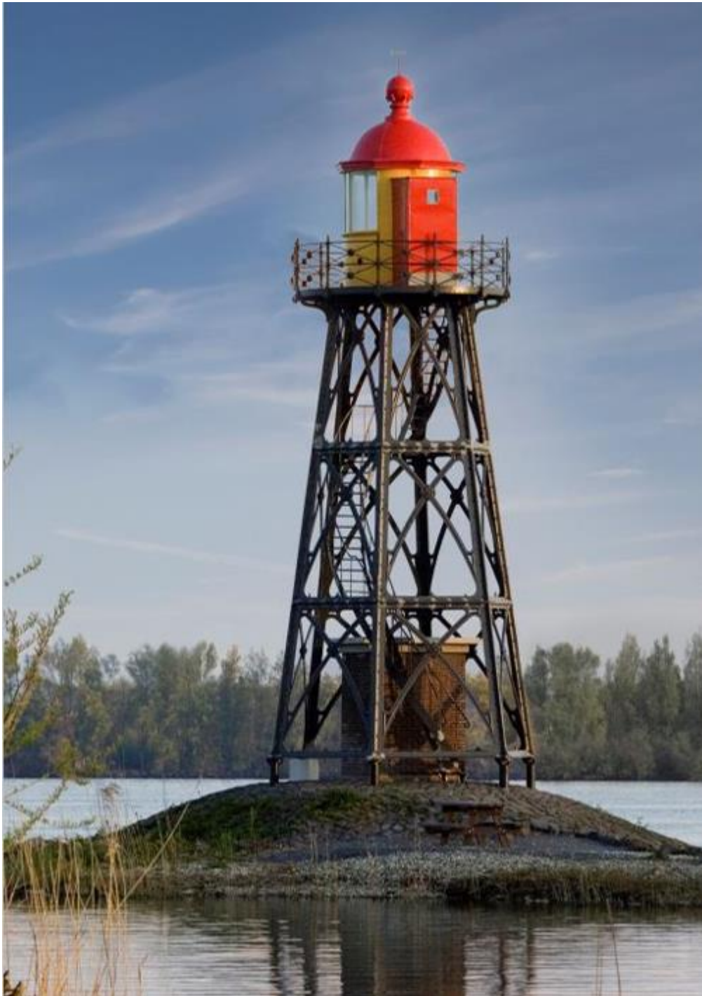
Lichtopstand in Strijensas (gemeentelijk monument)

Coproductie met Erfgoedhuis Zuid-Holland