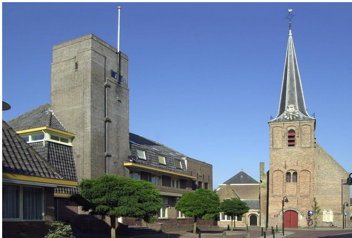
Grote- of St. Lambertuskerk en links het voormalige Raadhuis van Strijen (beiden Rijksmonument)

Een belangrijke actuele opgave is een goede communicatie tussen het lokale erfgoedveld, burgers en ondernemers/ontwikkelaars, omdat hiermee het draagvlak aanzienlijk kan worden vergroot en versterkt. Daarmee wordt een succesvol beleid aanmerkelijk kansrijker.