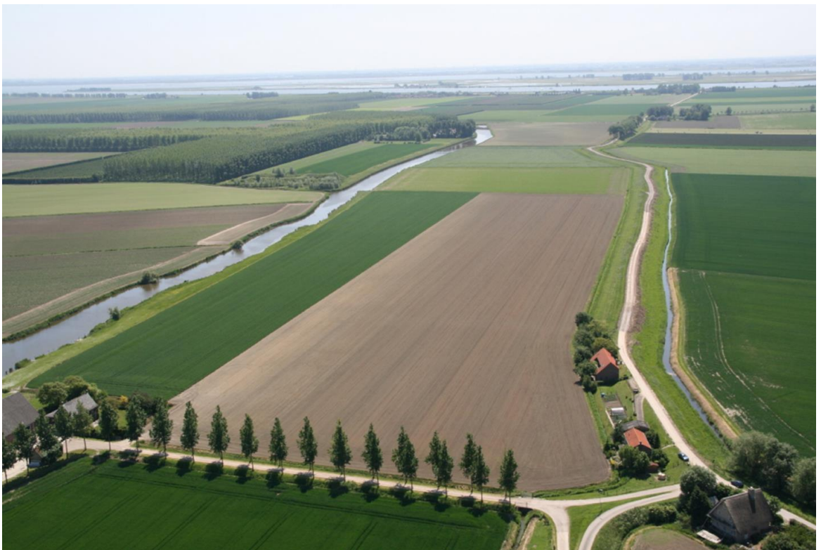
Cultuurlandschap van de Hoeksche Waard