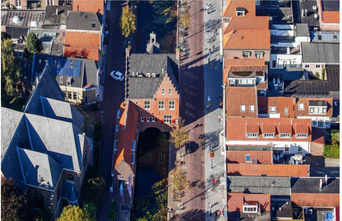
Raadhuis Oud-Beijerland, gebouwd in 1622 op een brug over het water van de Voorstraat (Rijksmonument)