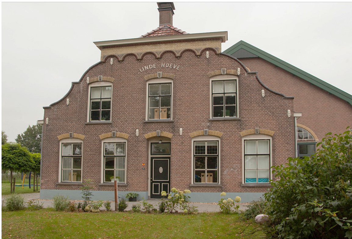
Herbestemmen van (agrarisch) erfgoed is een grote uitdaging ook in de Hoeksche Waard. Op de foto: zorgboerderij Linde Hoeve in Strijen