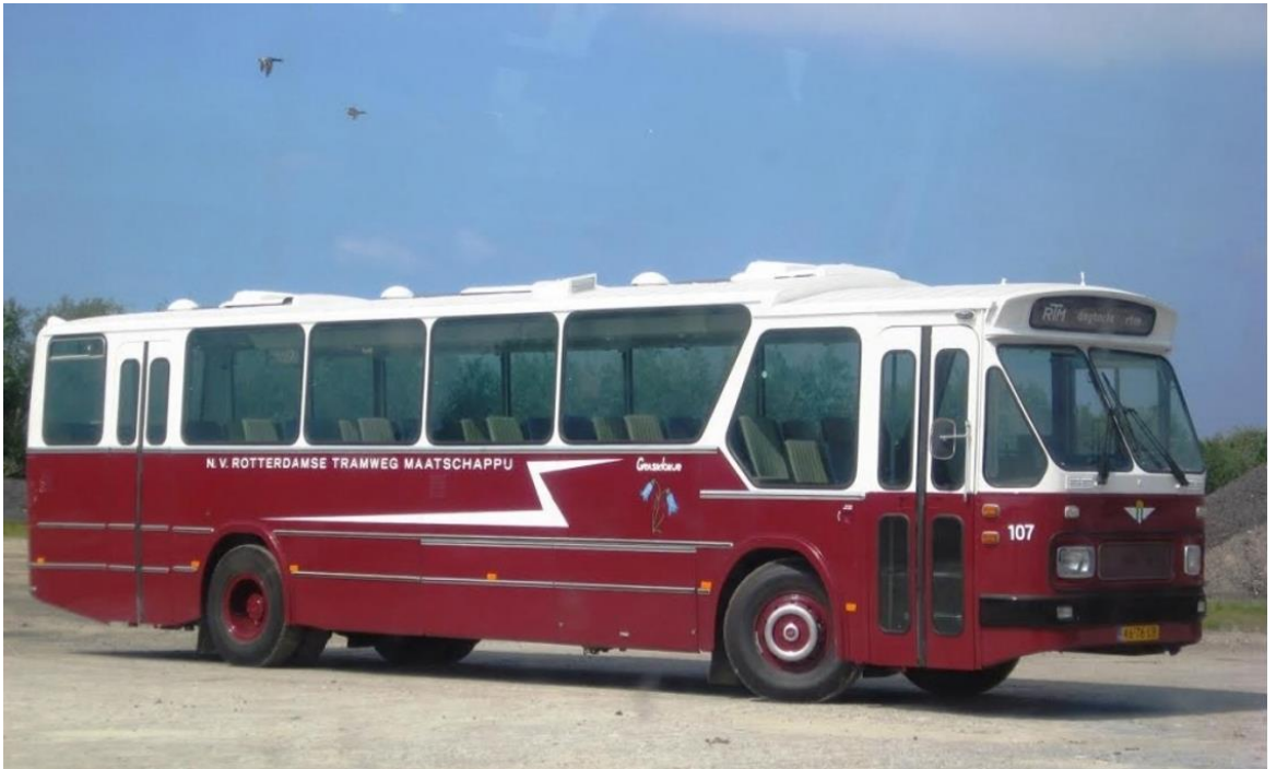
RTM Bus uit de jaren zestig van de vorige eeuw

De erfgoedinstelling vragen van gemeente Hoeksche Waard een coördinerende en faciliterende rol. Wij streven ernaar om in gezamenlijkheid met de partners uit het lokale erfgoedveld op te trekken om erfgoed verder te promoten voor inwoners en bezoekers/ recreanten.