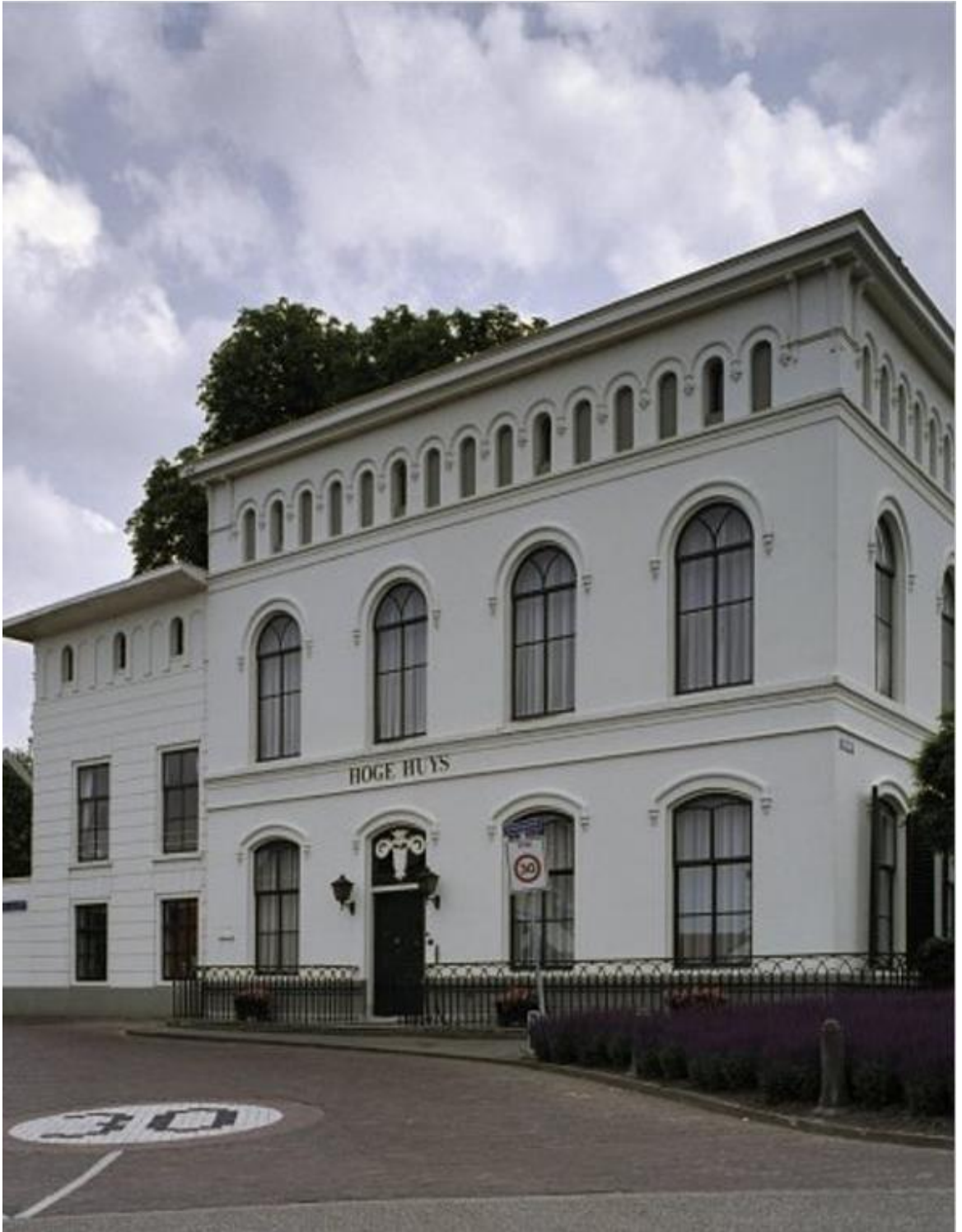
Het 'Hoge Huys' aan de Schuringsdijk 2 in Numansdorp (rijks monument)