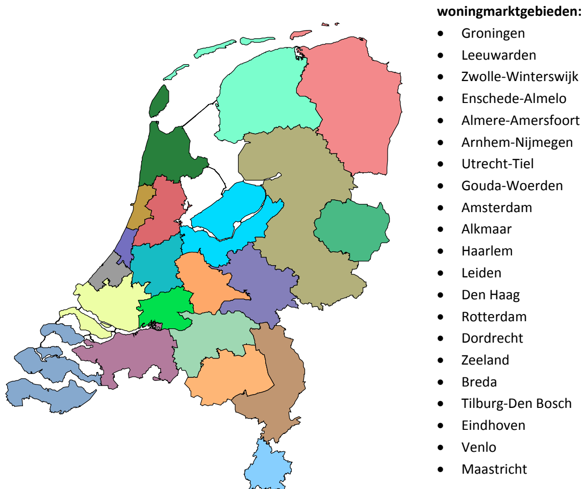
Figuur B2.1: Onderscheiden woningmarktgebieden in de nul-meting

een extra stap gezet in de clustering, waarbij Tielerlanden samengevoegd is met het woningmarktgebied Utrecht. Door deze extra stap in de clustering komt het percentage intergemeentelijke verhuizingen binnen de woningmarktgebieden iets boven de 75%.