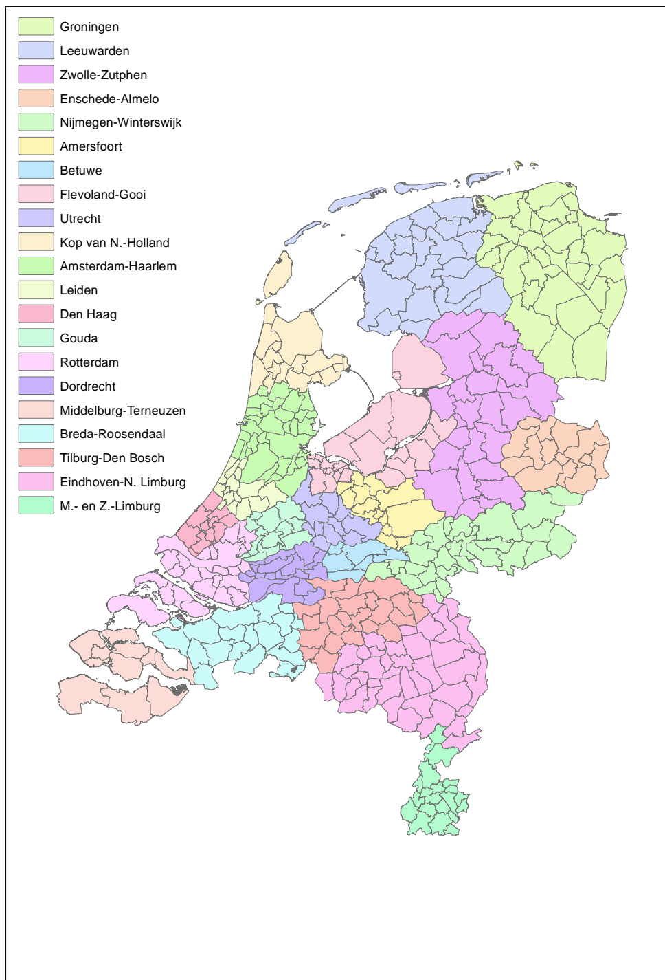
Figuur B2.2: Onderscheiden woningmarktgebieden in de vervolgmeting (intramax 2005)