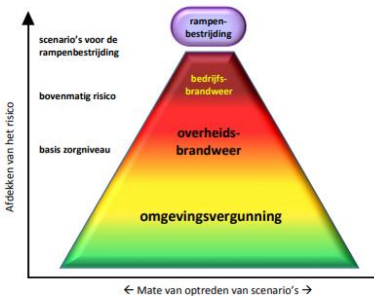
Figuur 1 Risicoafdekking openbare veiligheid